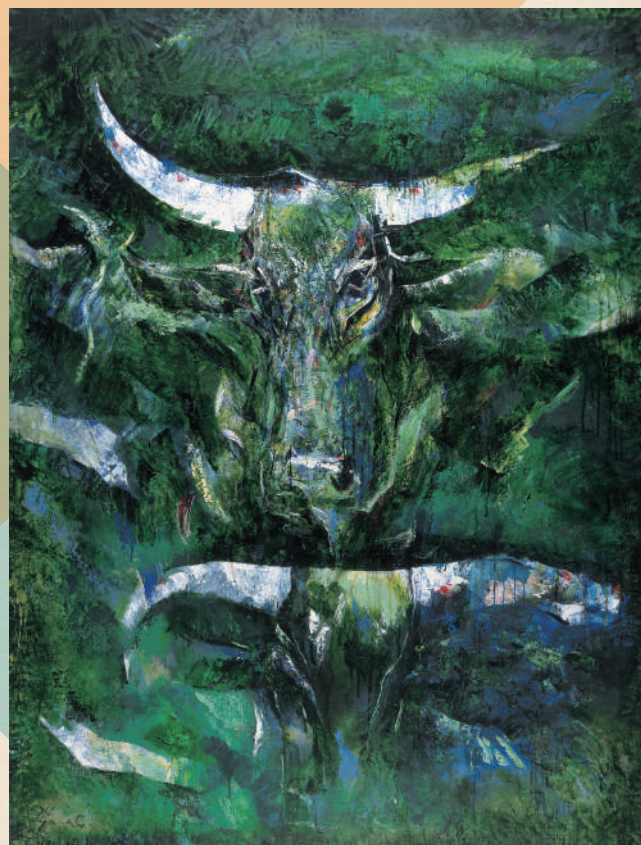
柳悟《烈聖牛》1974年、当館蔵