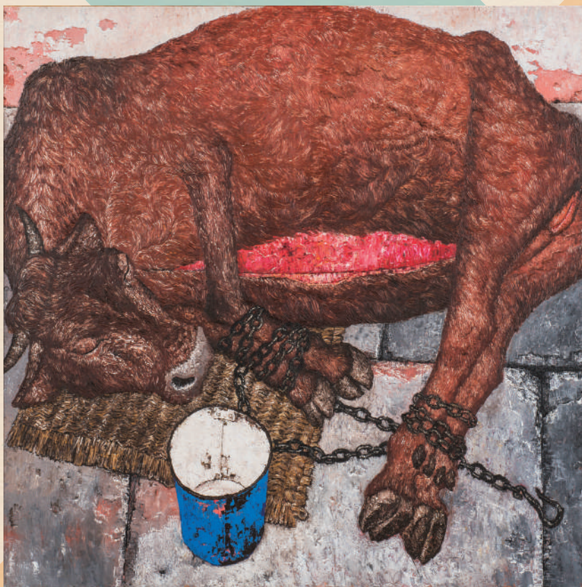
神田日勝《牛》1964年、神田日勝記念美術館蔵